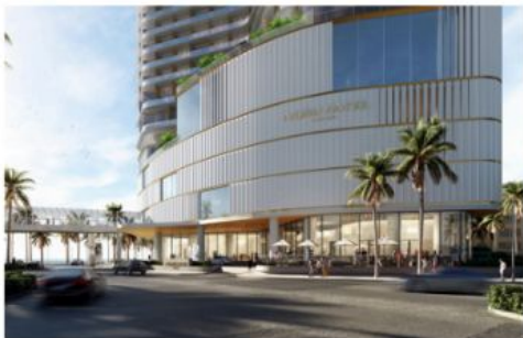
Hướng từ đường Võ Văn Kiệt đến Nobu Đà Nẵng